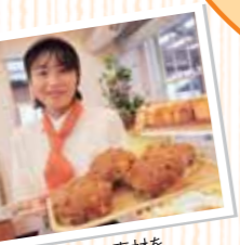
定番から季節の素材をつかったものなど、100種類以上の品揃え!