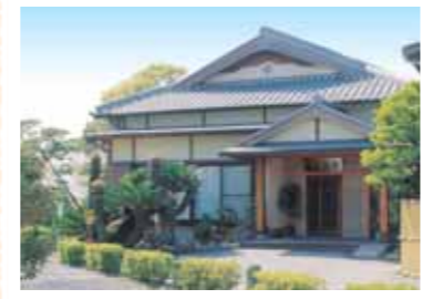
食事だけでなく、周りの風景や環境も味わい深い。