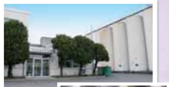
迫力のある白く大きな貯蔵タンクがスラリ。

プレゼント③ 「本醸造 一途な恋」(720ml)を5名様にプレゼントいたします。