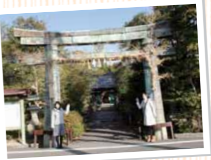
青い銅製鳥居には目を引く存在感がある。