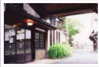
360年余という長い歴史を見つめてきた酒蔵と町並み。