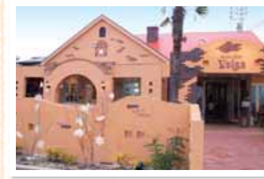
オレンジ色の屋根とレンガ調の壁は、一度見たら忘れられない。