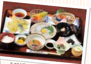
2,000円の昼御膳。季節や日によってのメニューが楽しめる。お座敷でお庭を眺めながらゆったりと。