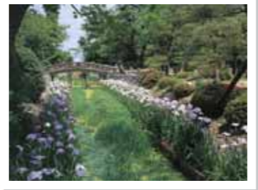
菖蒲は毎年5月下旬~6月中旬が見所。