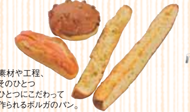
素材や工程、そのひとつひとつにこだわって作られるボルガのパン。