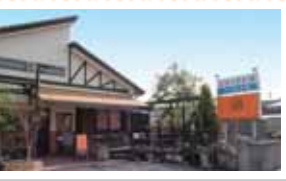
オレンジ色の看板がすぐ目に入るので、見つけやすい。