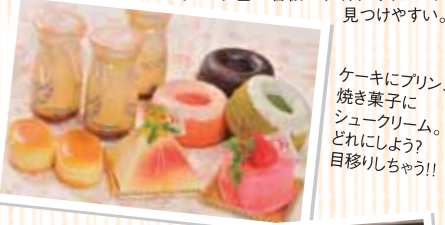
ケーキにプリン、焼き菓みにシュークリーム。どれにしよう? 目移りしちゃう!!