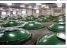
40本以上もある貯蔵タンクは、コンピューターでしっかり温度管理されている。