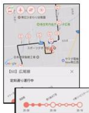
PINA 画面表示イメージ