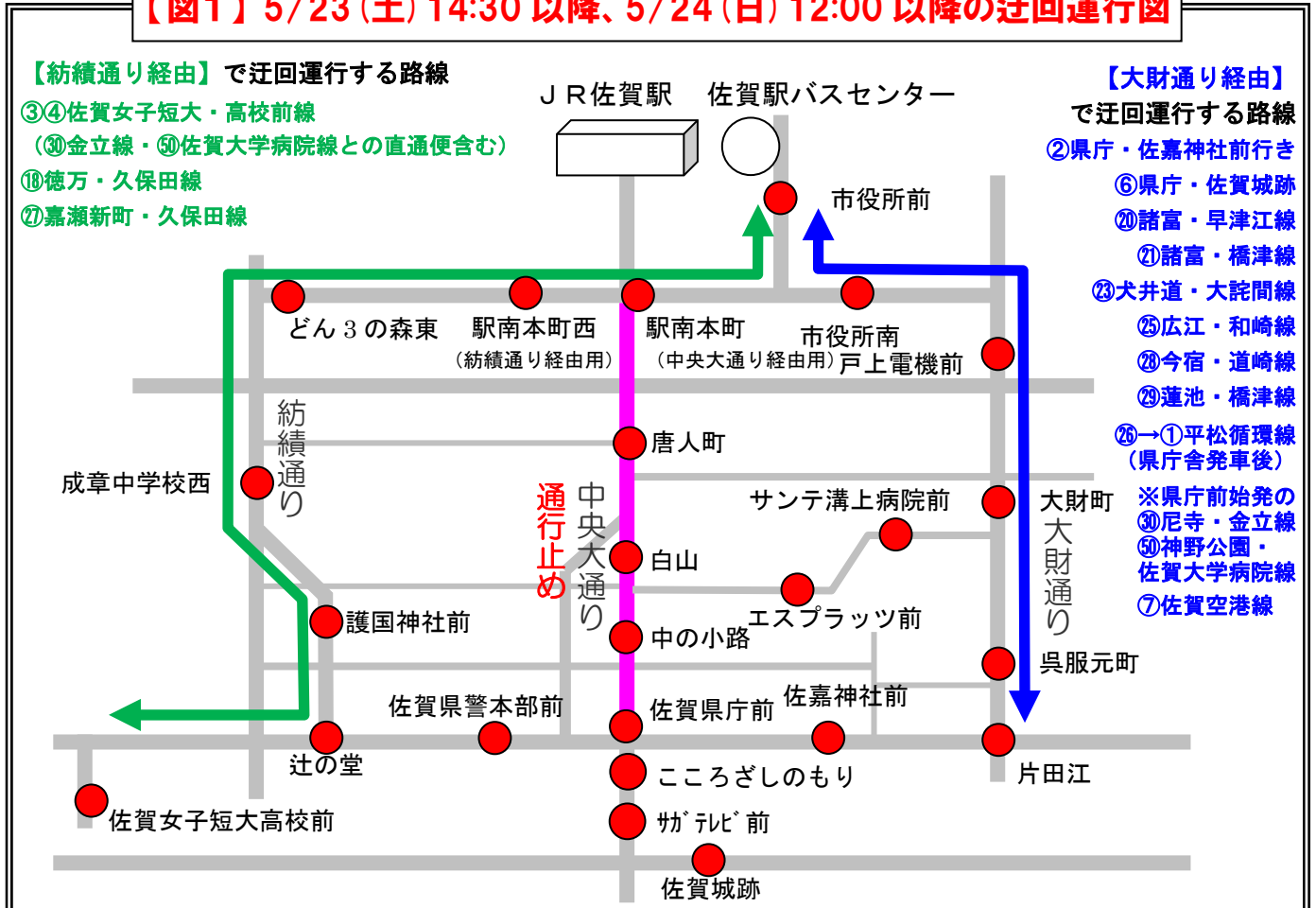
【図1】5/23(土) 14:30以降、5/24(日) 12:00以降の迂回運行図